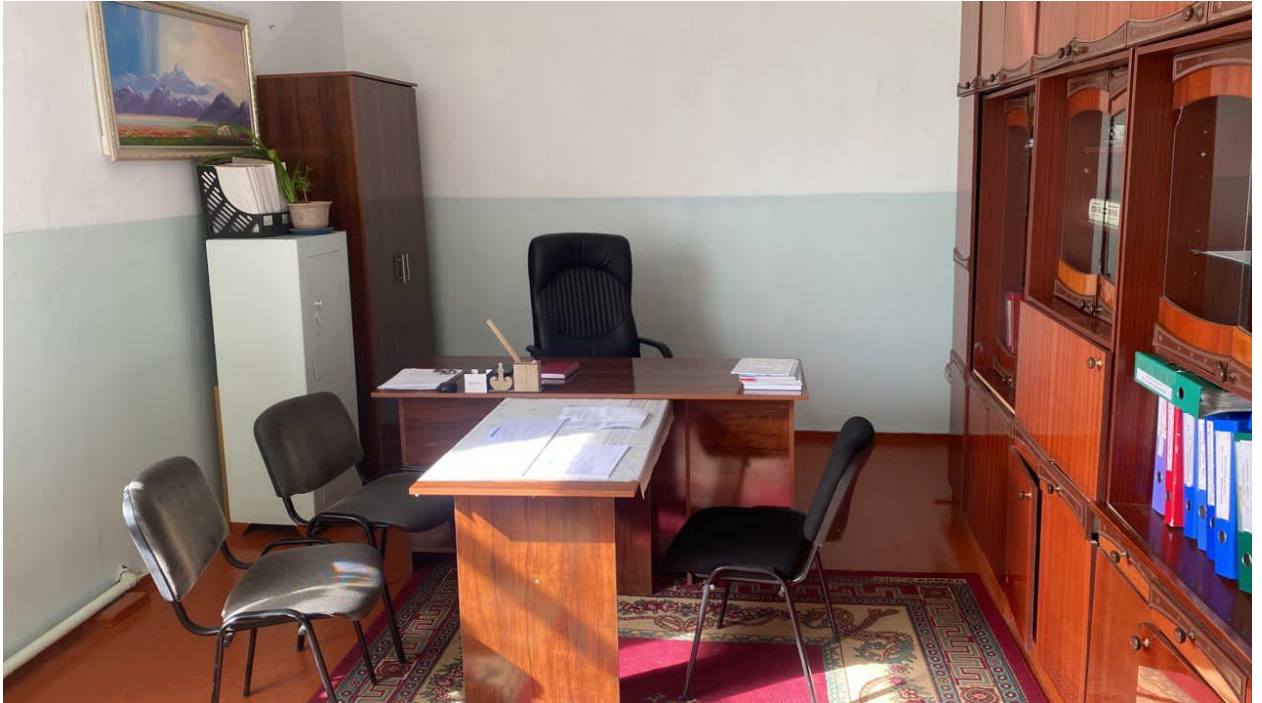
Мектеп директорунун каанасы